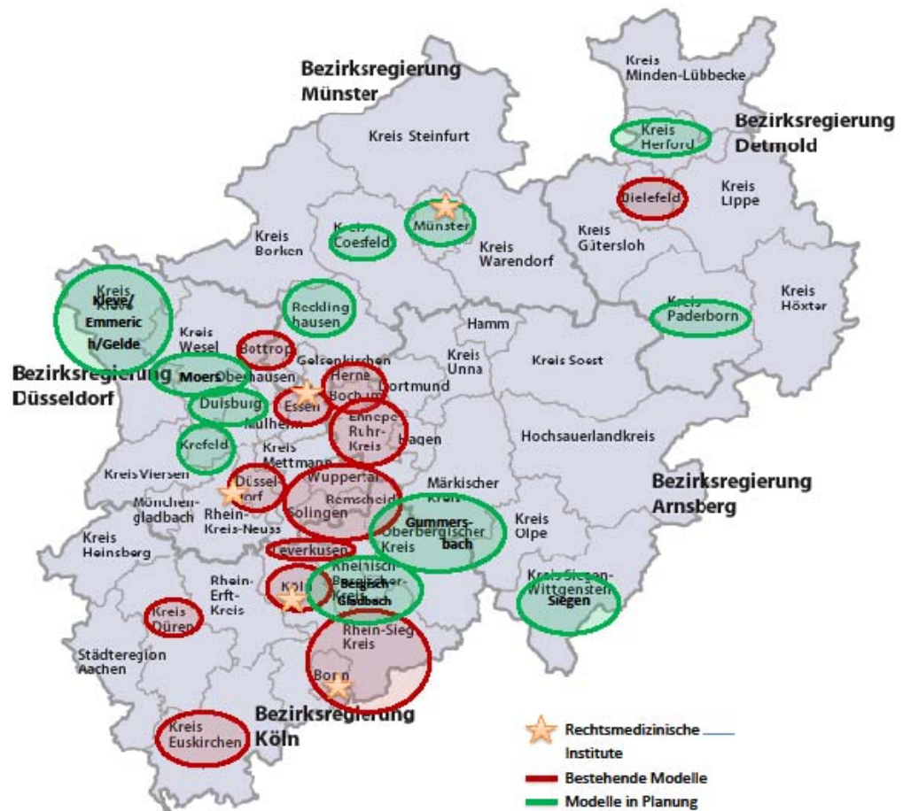
Abbildung 2: Karte der bestehenden und in Planung befindenden ASS- Projekte in NRW.

Die im vorangegangenen Arbeitsschritt identifizierten ASS- Projekte wurden in der folgenden Grafik (siehe Abbildung 2) zusammengefasst. Es fand eine Unterscheidung in „Bestehende Modell“ und „Modelle in Planung“ statt. Bestehende ASS-Projekte befinden sich demnach in Bonn/Rhein-Sieg, Bochum/Herne, Bottrop/Gladbeck, Düren/Jülich, Düsseldorf, Ennepe-Ruhr-Kreis mit Schwelm und Witten, Euskirchen, Köln, Wuppertal/Remscheid/Solingen und Leverkusen. Bielefeld hält ein Modell der Vertraulichen Spurensicherung vor, welches einen etwas anderen Ansatz verfolgt.