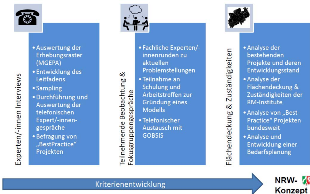
Abbildung 1: Säulen der Bestandsaufnahme.

Daran anknüpfend wurde ein Methodendesign mit einem dreisäuligen Vorgehen erarbeitet, welches in Abbildung 1 dargestellt ist.