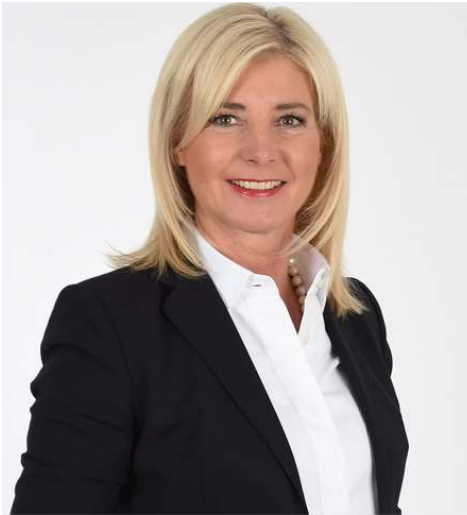
Staatsministerin Ulrike Scharf