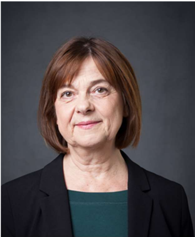
Ministerin Ursula Nonnemacher