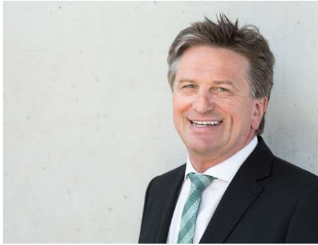
Minister Manne Lucha