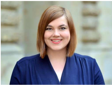
Senatorin Katharina Fegebank