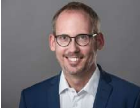
Staatsminister Kai Klose