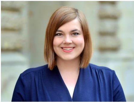
Senatorin Katharina Fegebank