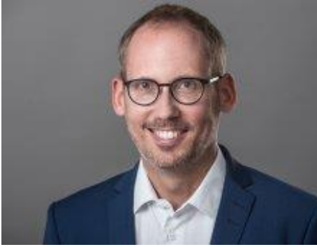
Staatsminister Kai Klose