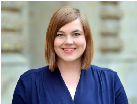
Senatorin Katharina Fegebank