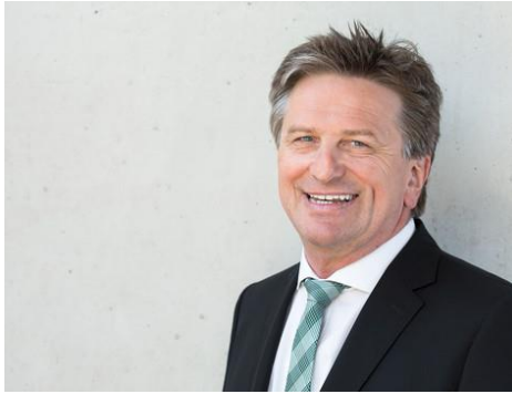
Minister Manfred Lucha