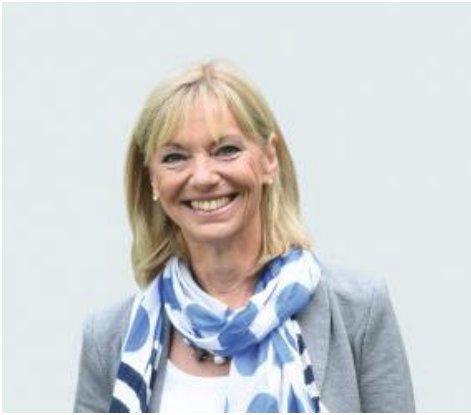
Staatsministerin Carolina Trautner